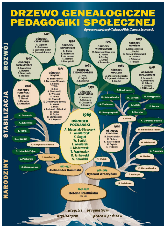
Fot. 2. Drzewo genealogiczne pedagogiki społecznej