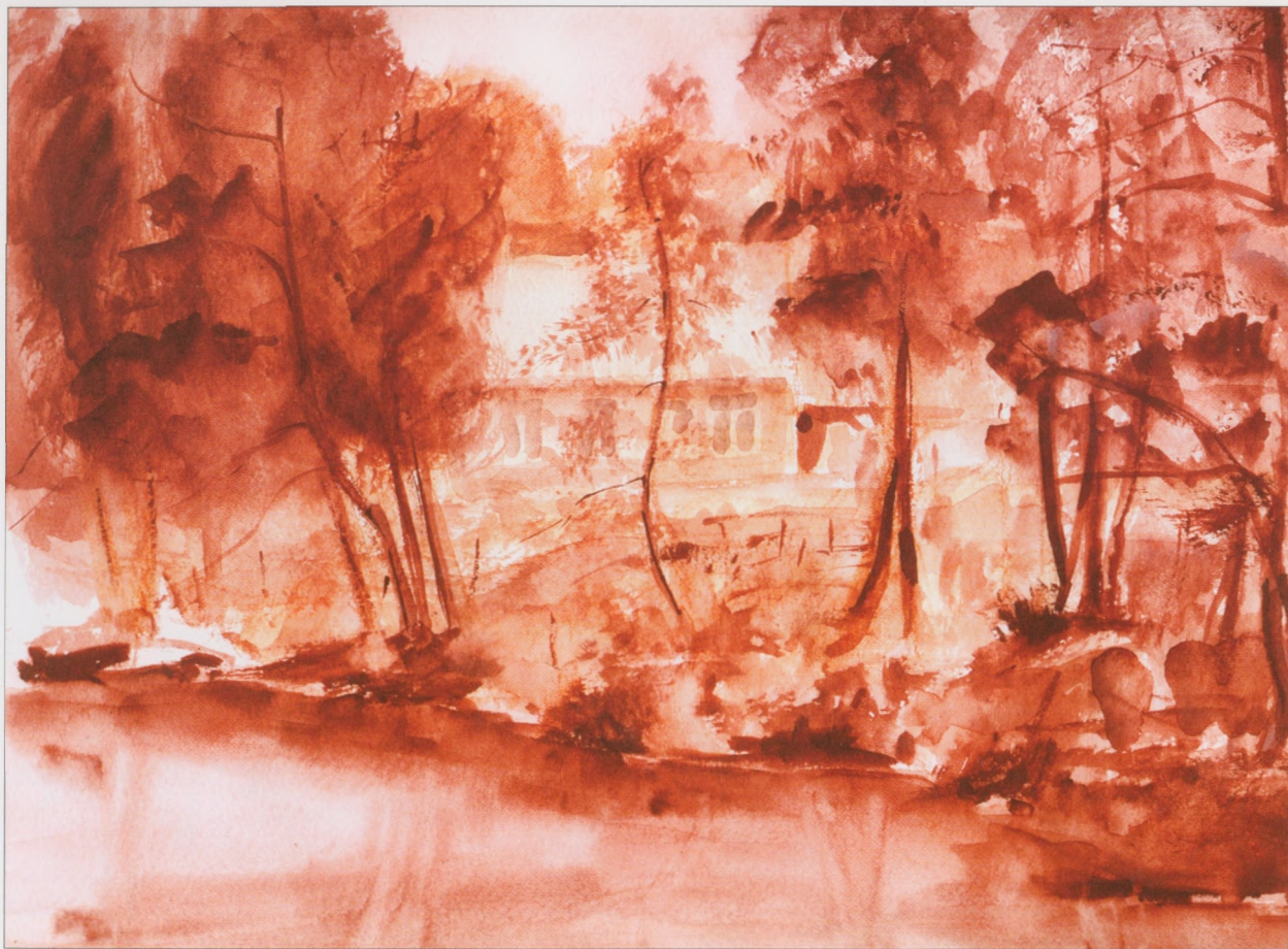
Skarżysko-Kamienna - Nowy Młyn, 2002, akwarela, 30×40 cm