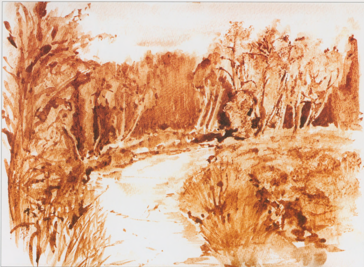
Skarżysko-Kamienna – Nowy Młyn, 2002, hematyt, 23×30 cm