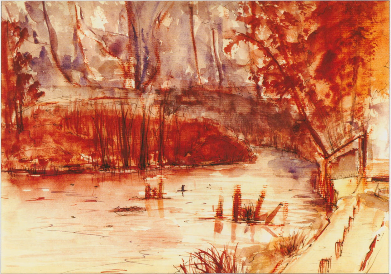
Skarżysko-Kamienna - Nowy Młyn, 2002, technika mieszana, 30×40 cm