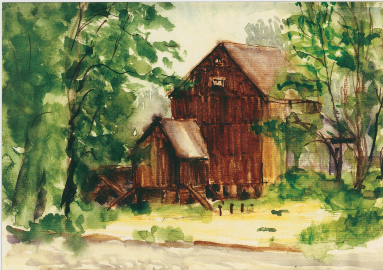
Skarżysko-Kamienna - Nowy Młyn, 2002 technika mieszana, 30×40 cm