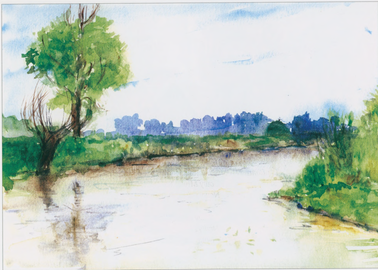
Skotniki , 2002, akwarela, 25×35 cm