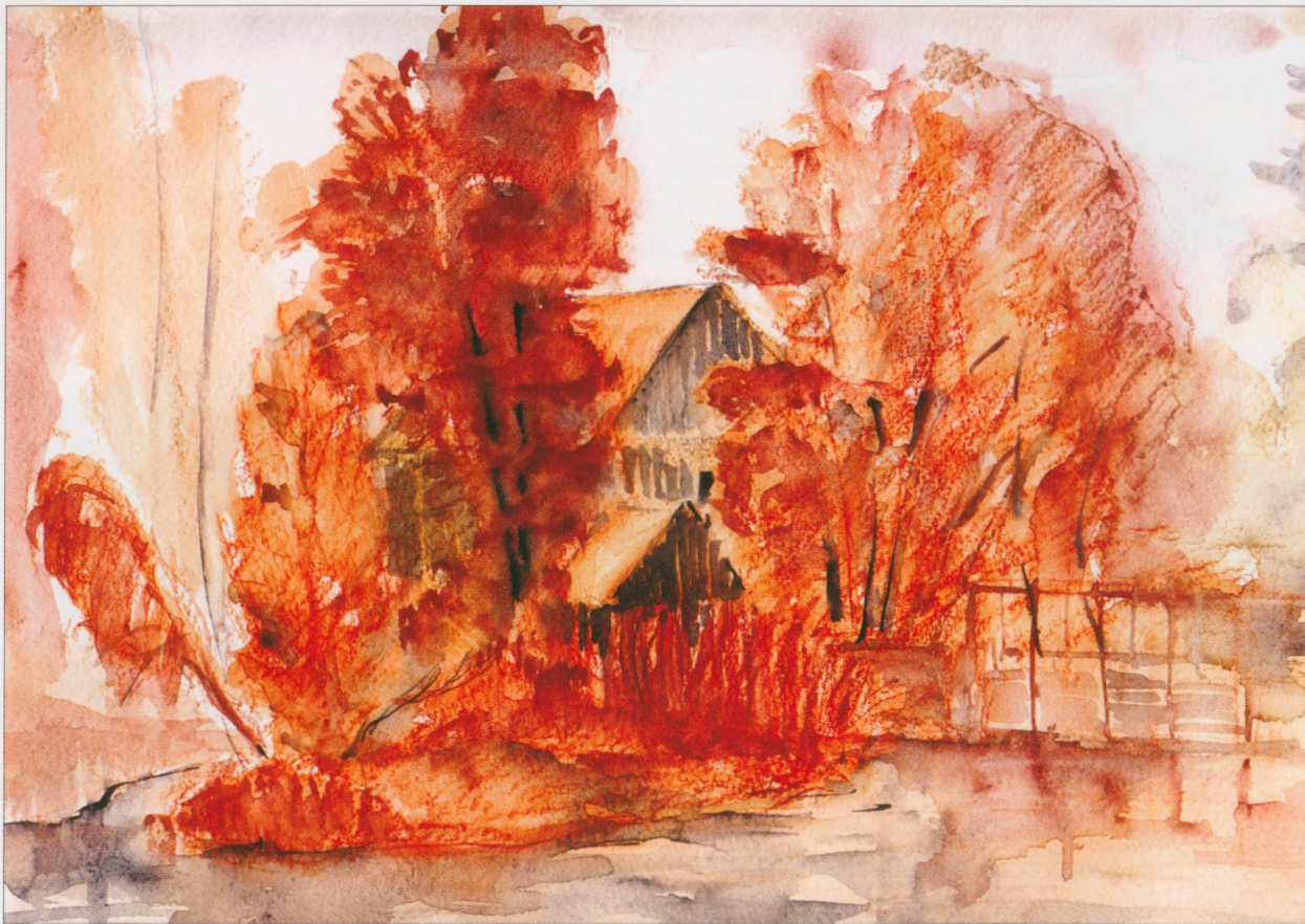
Skarżysko-Kamienna - Nowy Młyn, 2002, technika mieszana, 30×40 cm