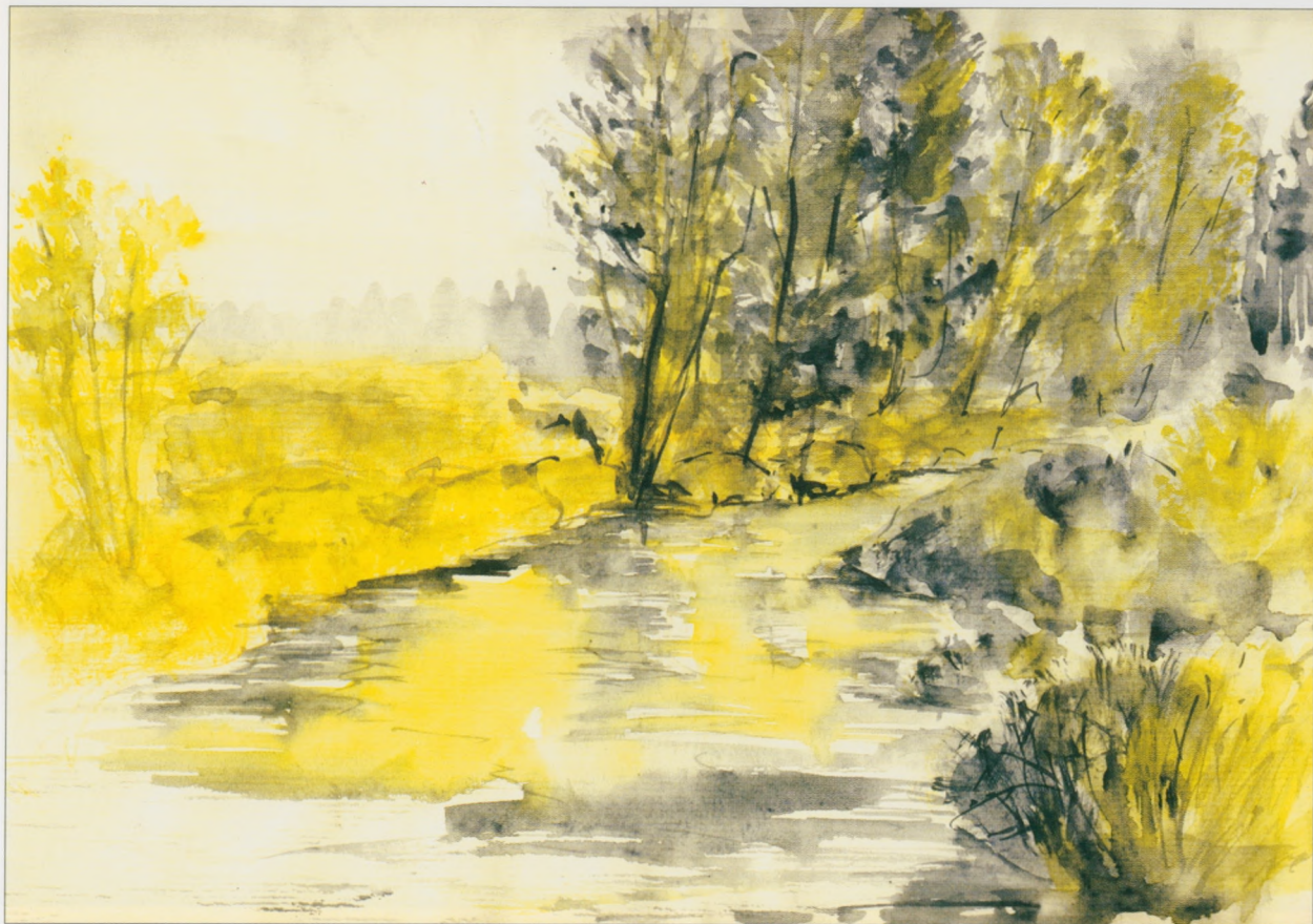
Skarżysko-Kamienna - Nowy Młyn, 2002, akwarela, 30×40 cm