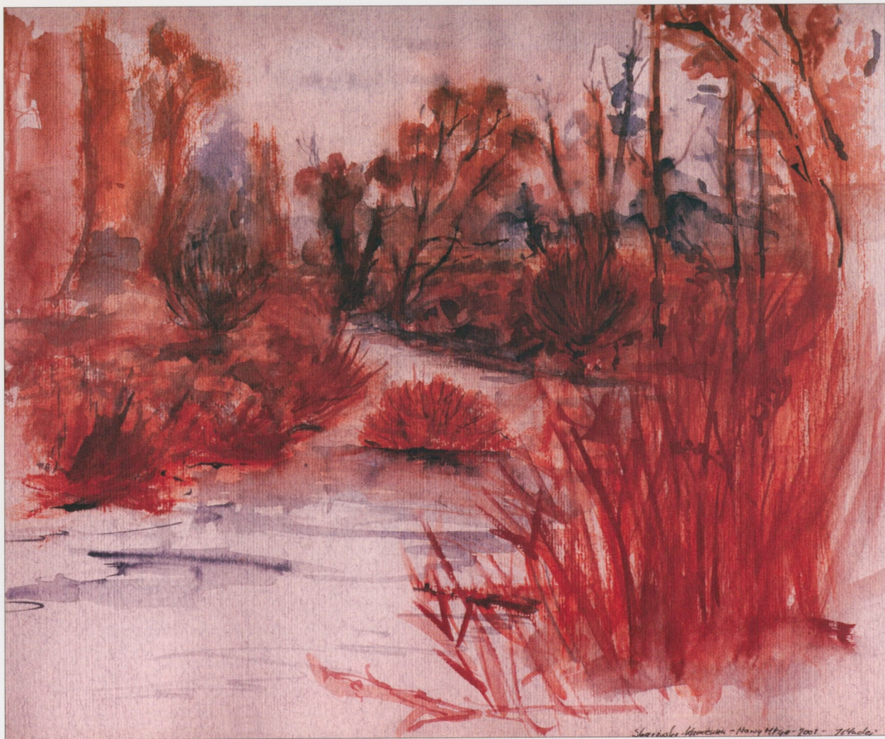
Skarżysko-Kamienna - Nowy Młyn, 2002, technika mieszana, 23×30 cm