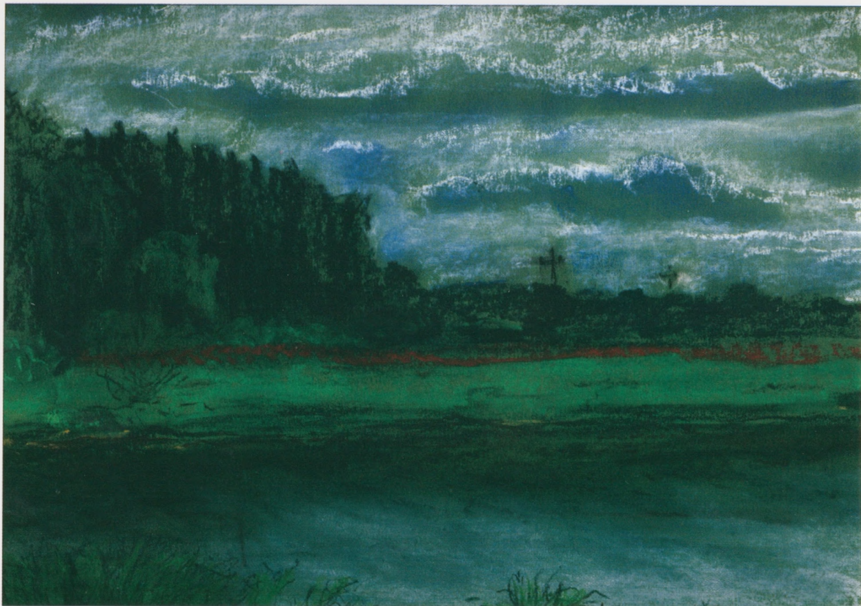
Chroberz , 2002, pastel, 28×38 cm