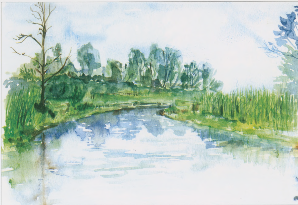
Czarkowy , 2002, akwarela, 25×35 cm