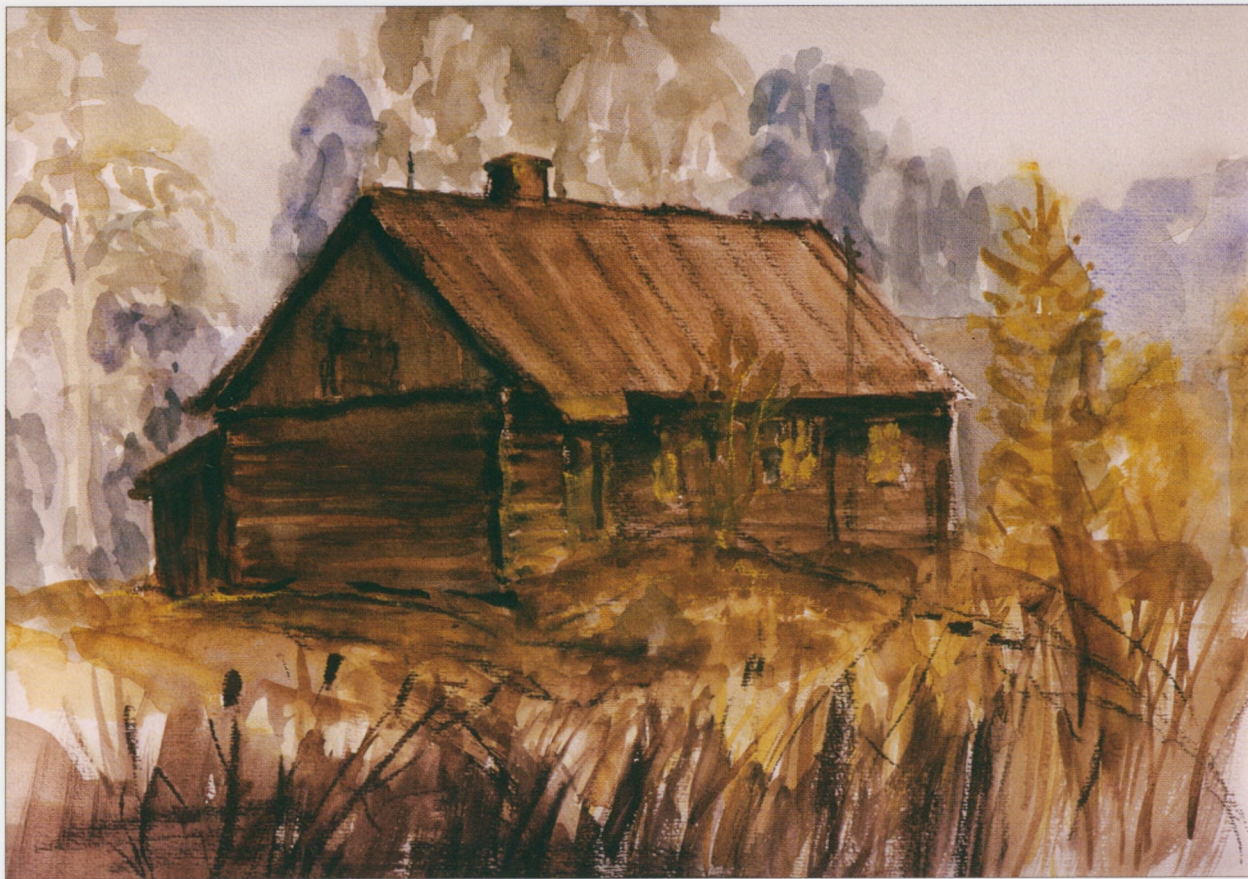
Skarżysko-Kamienna - Nowy Młyn, 2002, technika mieszana, 30×36 cm