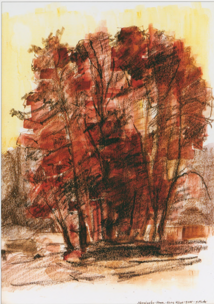
Skarżysko-Kamienna - Nowy Młyn, 2002, technika mieszana, 22×30 cm