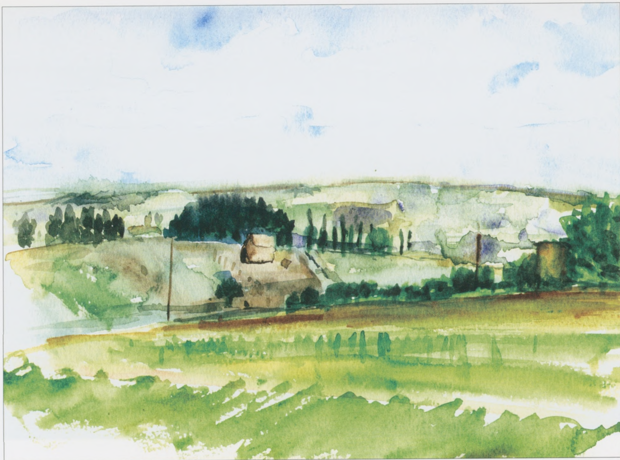
Busko-Zdrój , 2002, akwarela, 25×35 cm