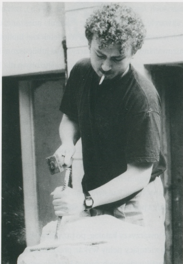
Artysta przy pracy