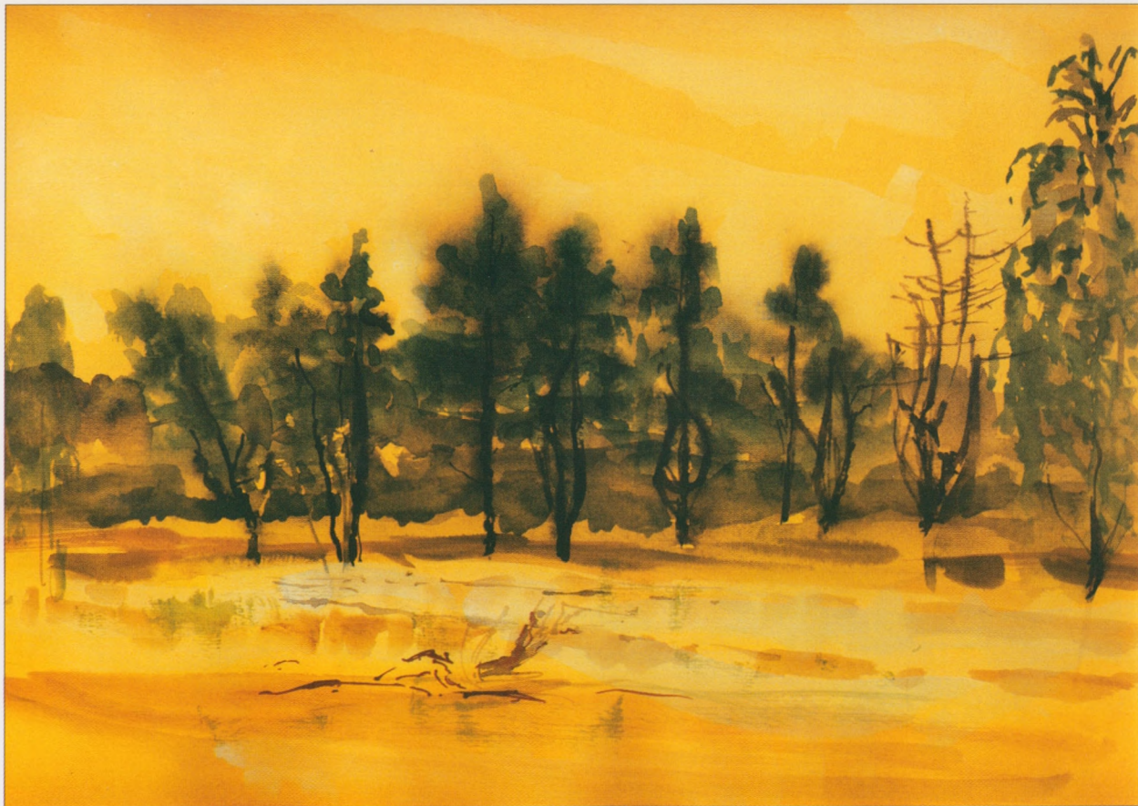
Skarżysko-Kamienna - Nowy Młyn, 2002, gwasz, 30×36 cm