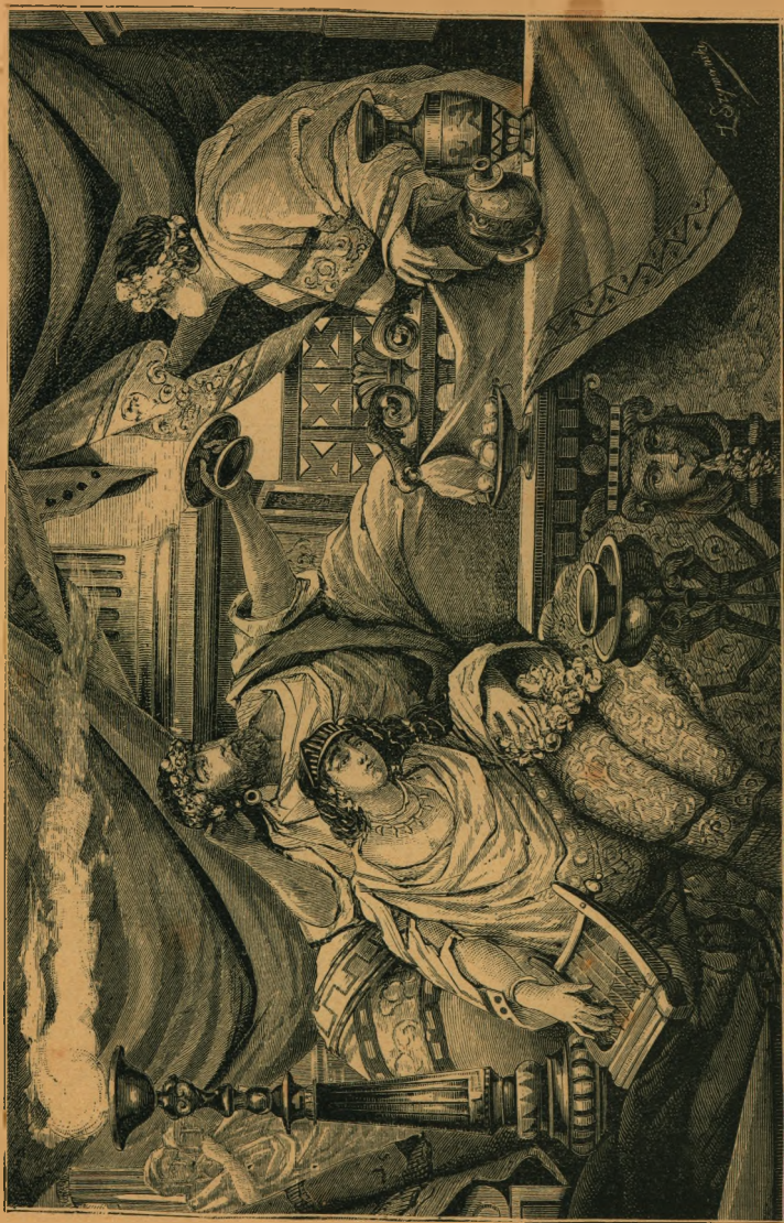
Do poezyi „Król Juba“ Adama Asnyka. Rysunek Franciszka Żmurki.