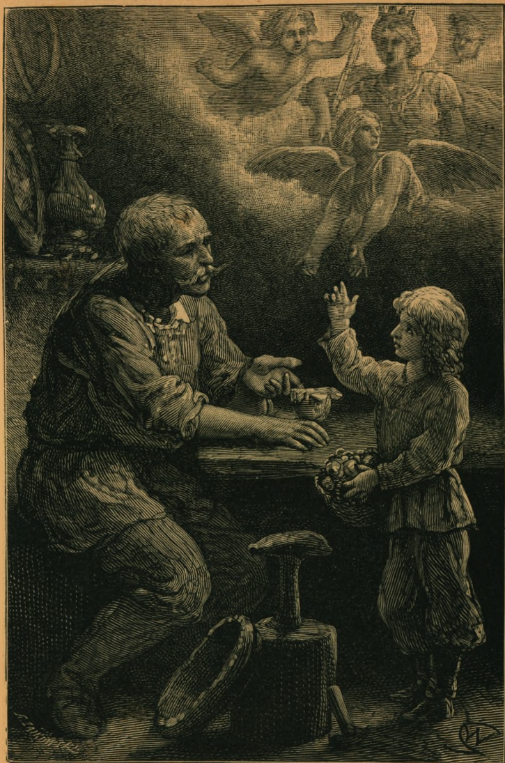
Do poezyi „Złoty Kubek“ T. Lenartowicza. Rysunek Wojciecha Gersona.