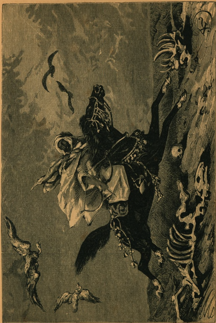
Do „Farysa“ Adama Mickiewicza. Rysunek Juliusza Kossaka.