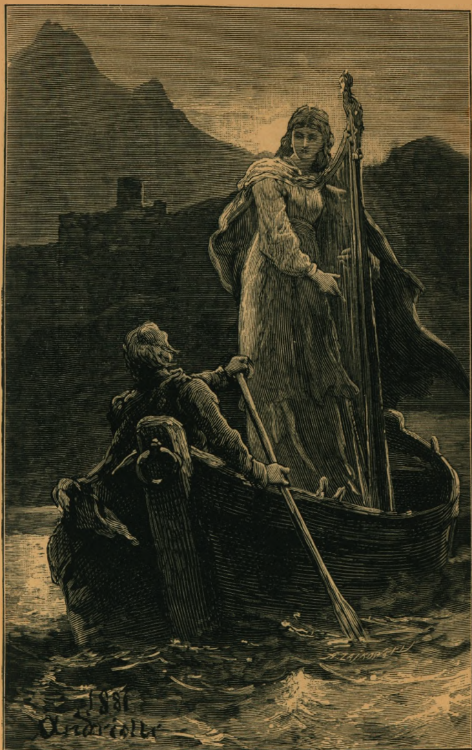
Do „Przedświtu“ Zygmunta Krasińskiego. Rysunek E. M. Andriollego.