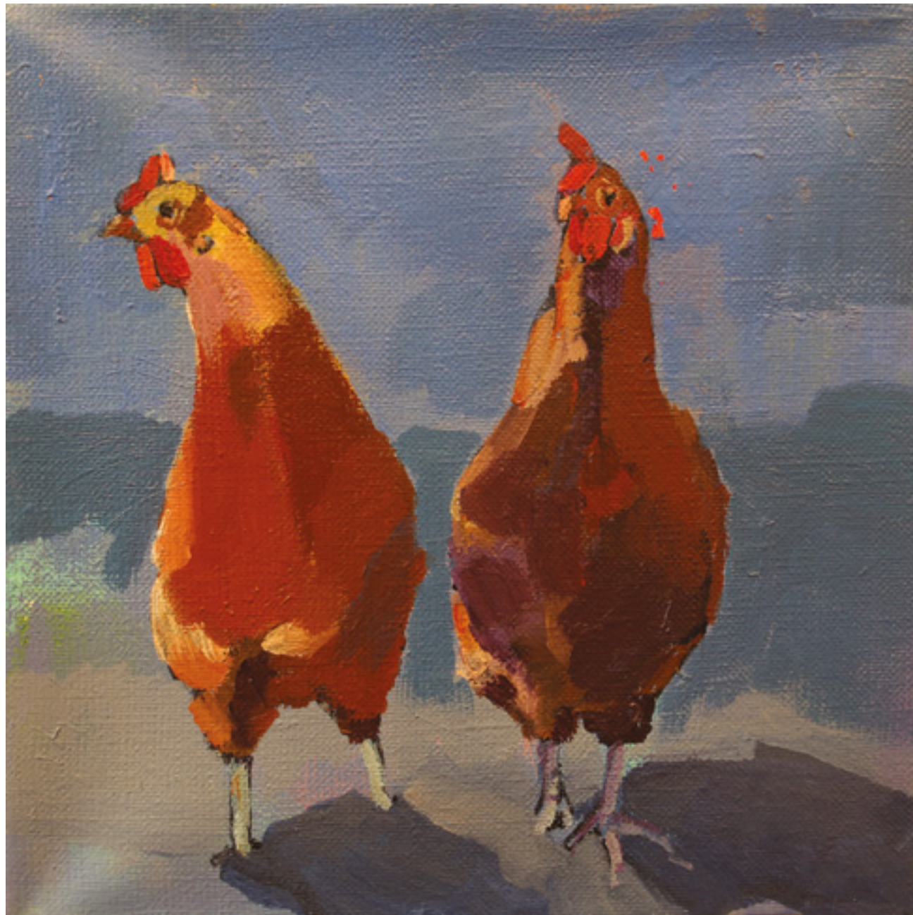
Kury w kurzym niebie XI , 20 x 20 cm, akryl na płótnie, 2020