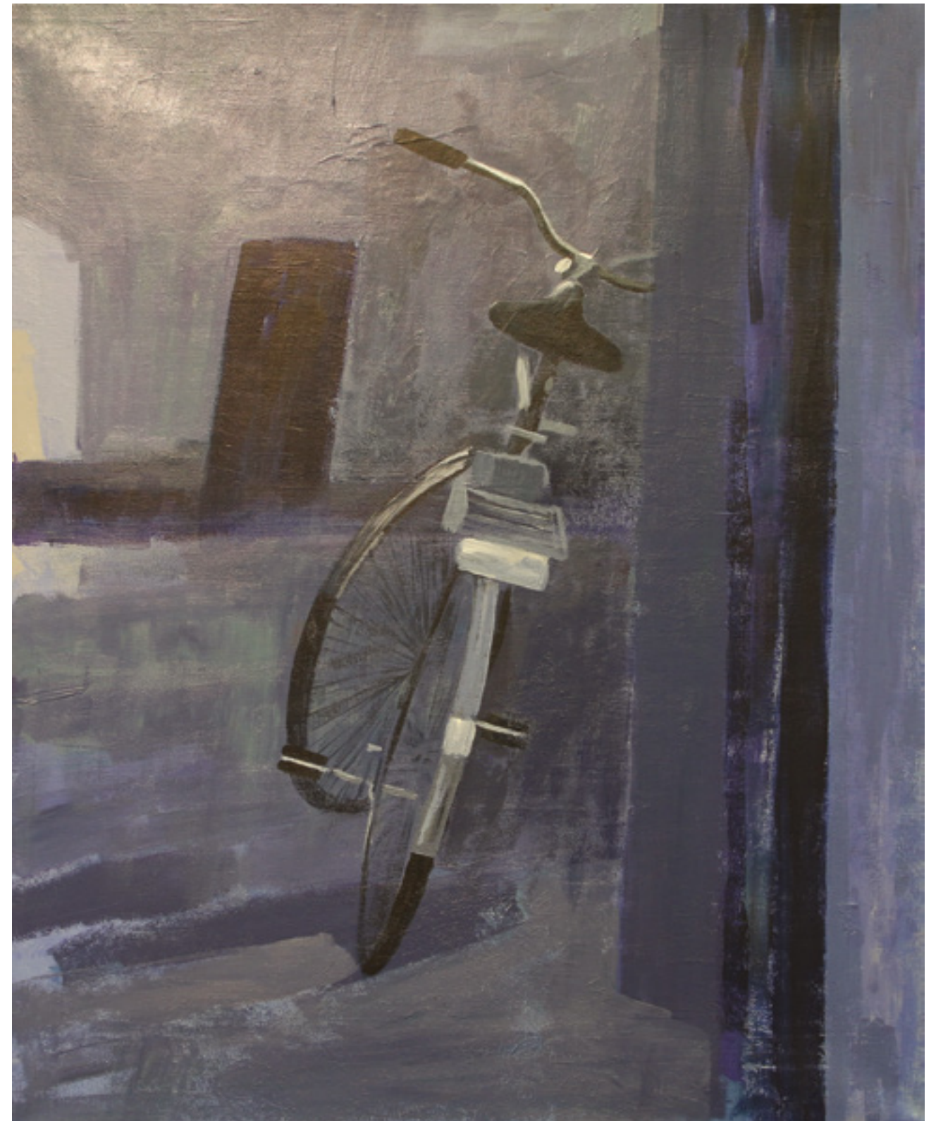
W klimacie niebieskim , 100 x 80 cm, akryl na płótnie, 2020