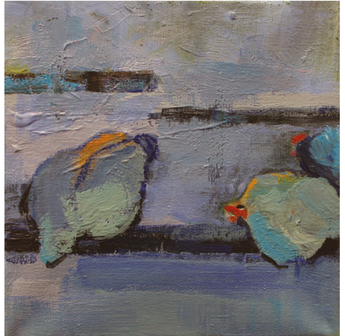
Kury w kurzym niebie XIV , 20 x 20 cm, akryl na płótnie, 2020