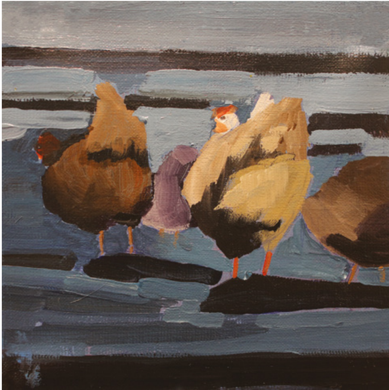
Kury w kurzym niebie XIII , 20 x 20 cm, akryl na płótnie, 2020