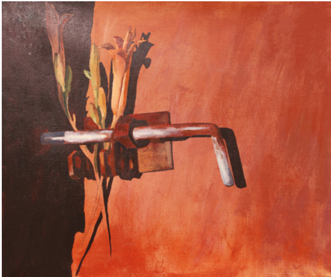
Lilia , 50 x 60 cm, akryl na płótnie, 2019