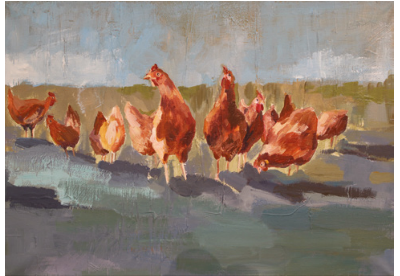
Szczęśliwe kury , 50 x 70 cm, akryl na płótnie, 2020