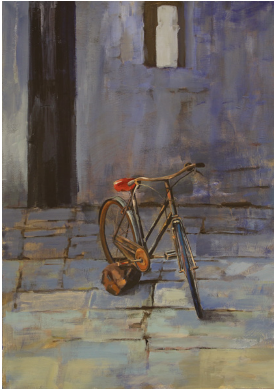
Z czerwonym akcentem , 100 x 70 cm, akryl na płótnie, 2020