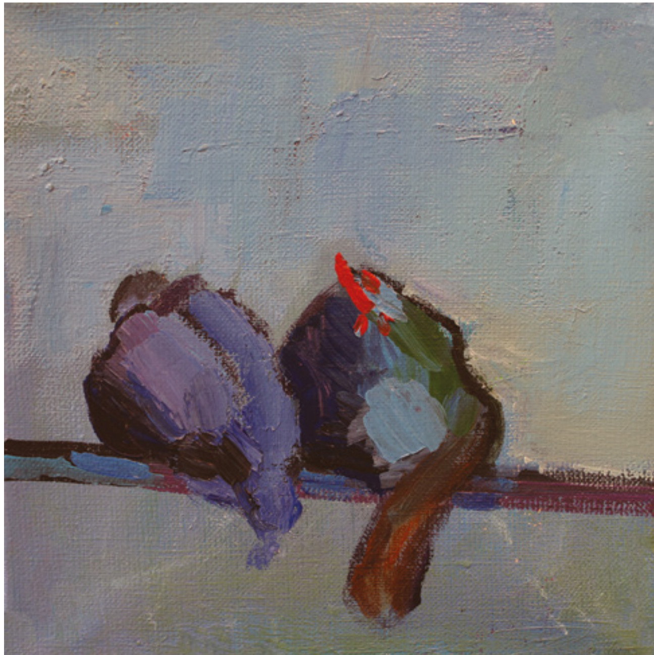
Kury w kurzym niebie III , 20 x 20 cm, akryl na płótnie, 2020