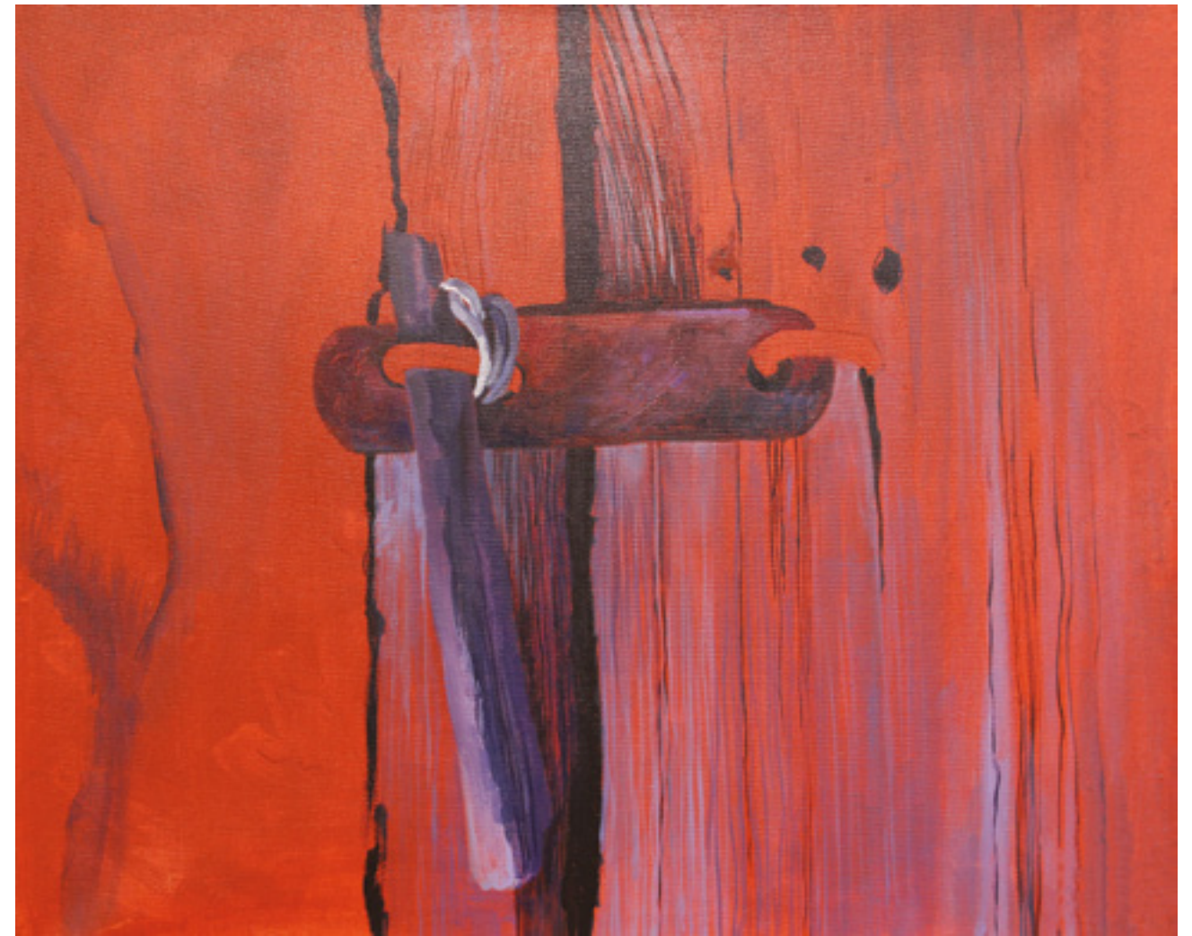
Skobel , 50 x 60 cm, akryl na płótnie, 2018