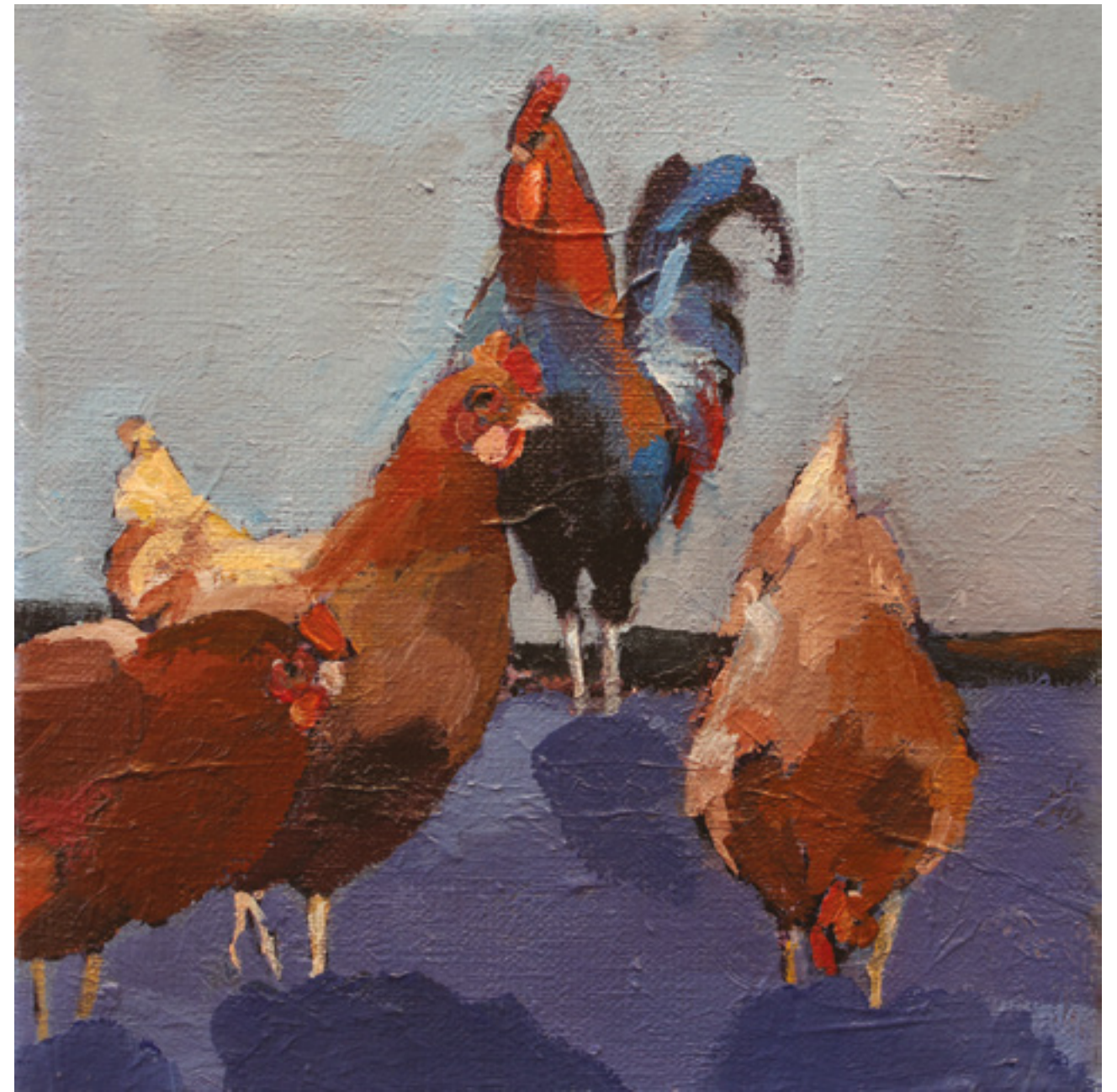
Kury w kurzym niebie XII , 20 x 20 cm, akryl na płótnie, 2020