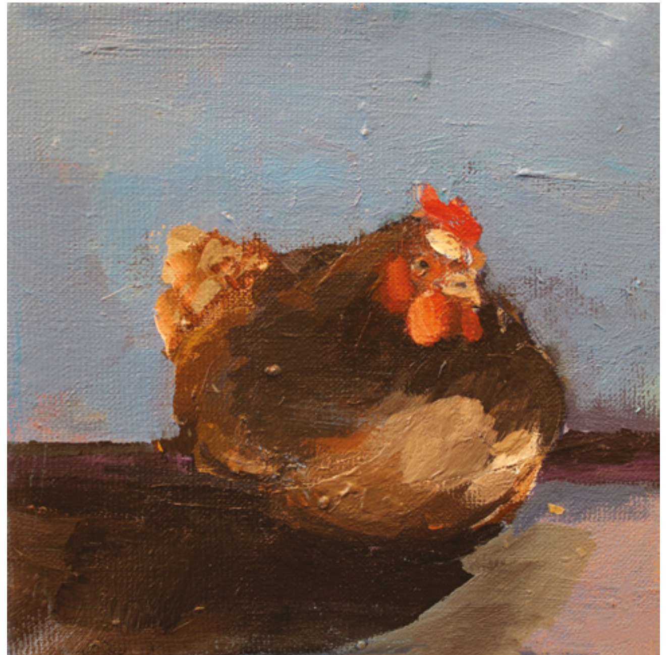
Kury w kurzym niebie X , 20 x 20 cm, akryl na płótnie, 2020