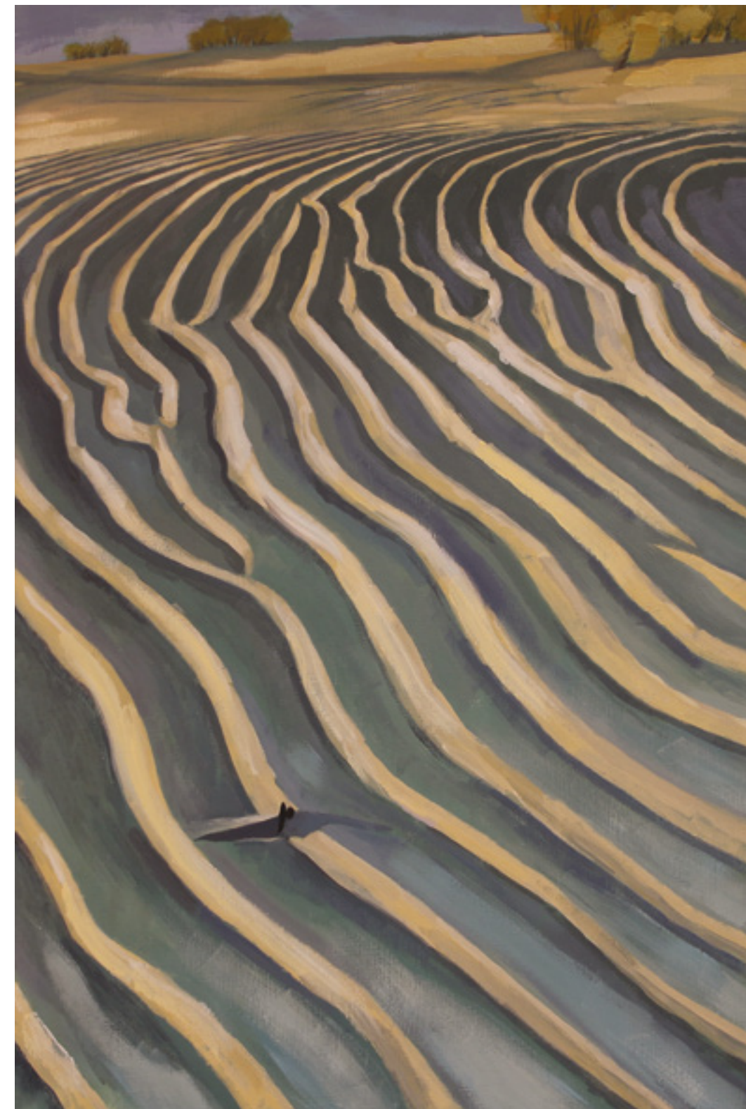
Rytmy , 90 x 60 cm, akryl na płótnie, 2020