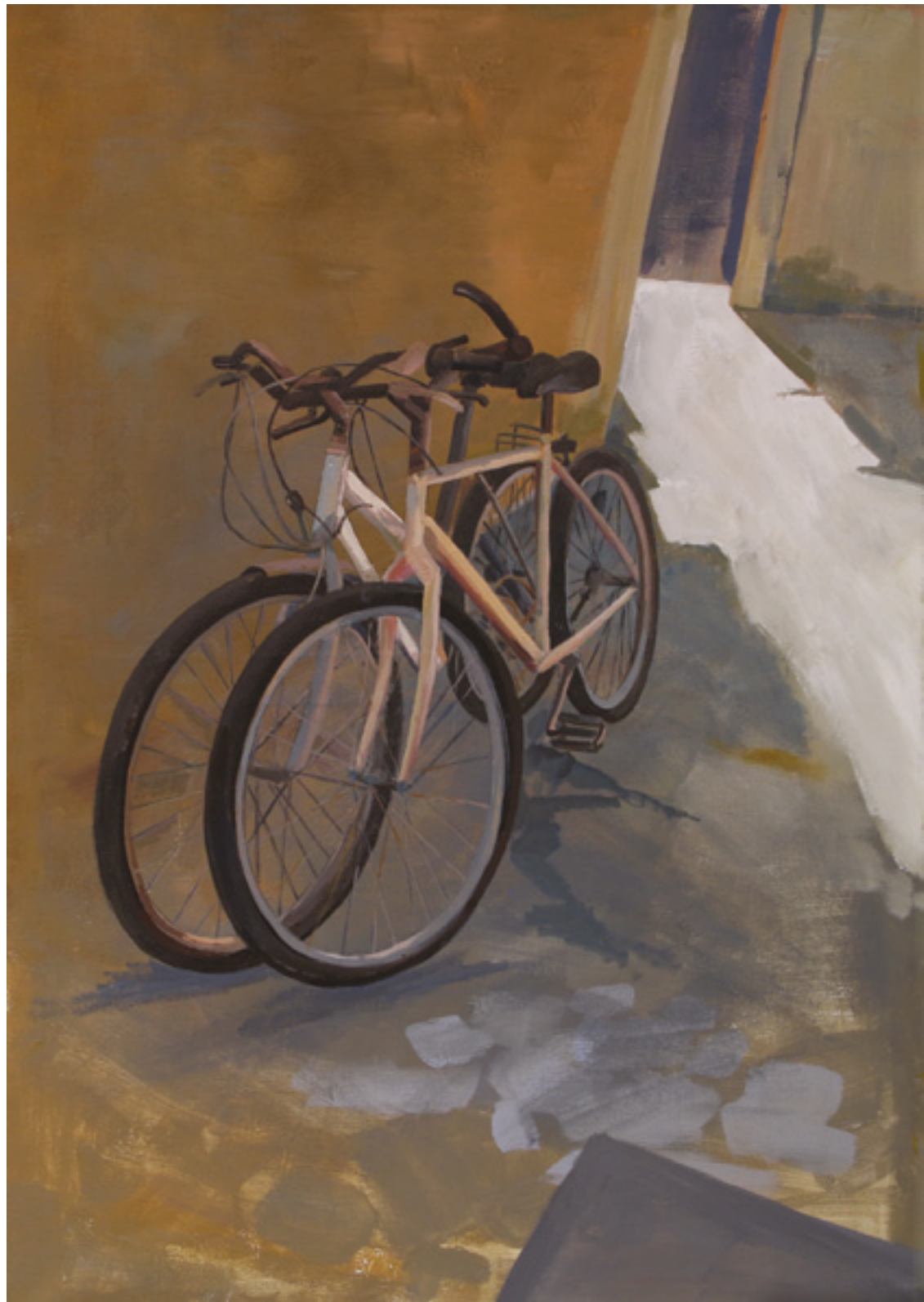
Wspomnienia , 100 x 70 cm, akryl na płótnie, 2020