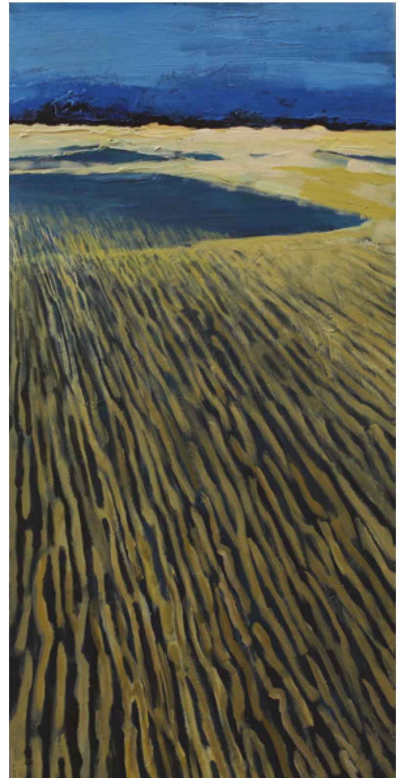
Wydmy I , 100 x 50 cm, akryl na płótnie, 2019