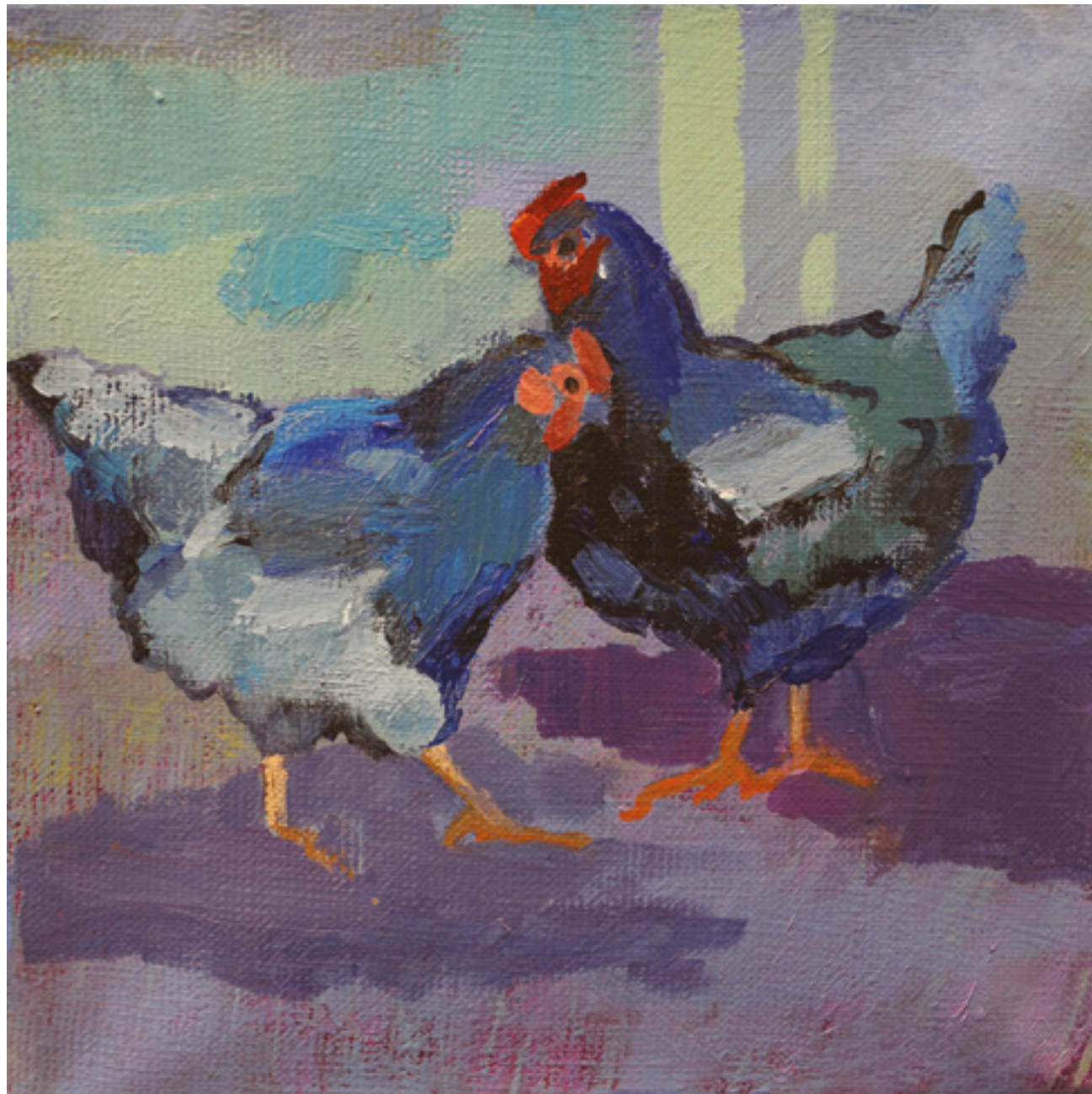
Kury w kurzym niebie V , 20 x 20 cm, akryl na płótnie, 2020