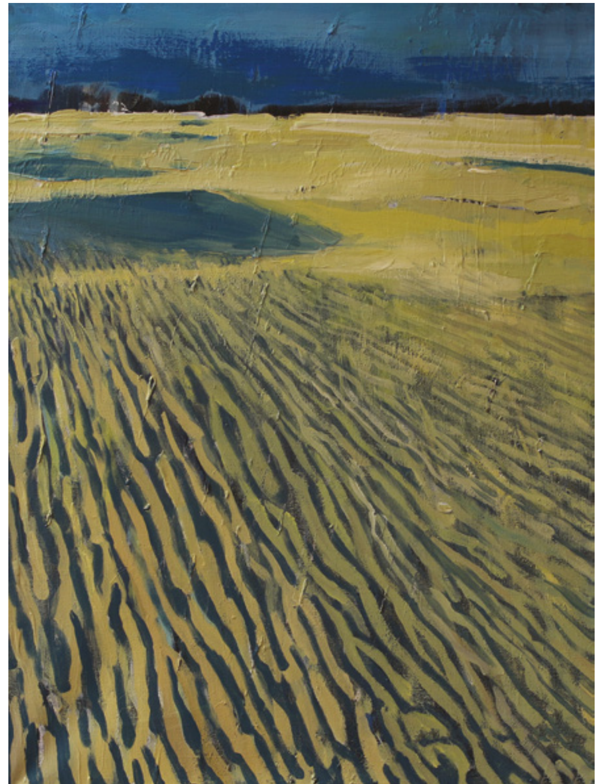
Wydmy III , 80 x 60 cm, akryl na płótnie, 2020