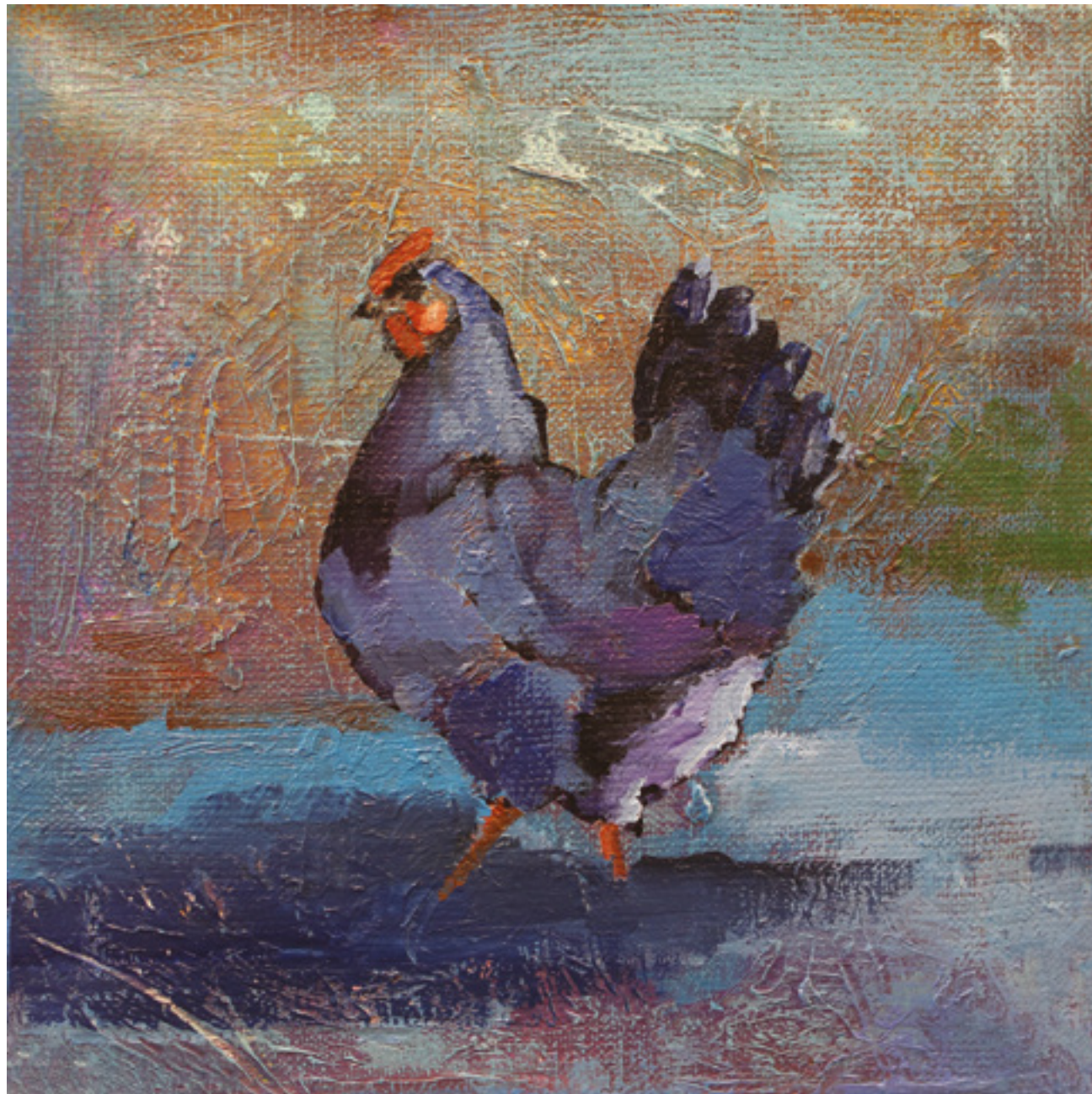
Kury w kurzym niebie IX , 20 x 20 cm, akryl na płótnie, 2020