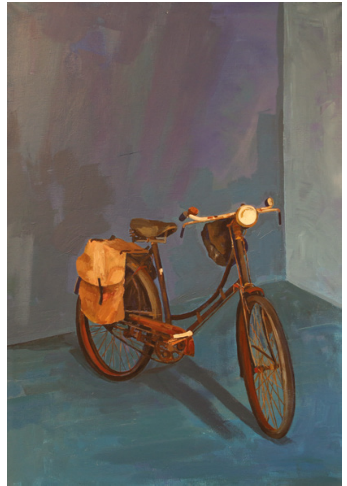
Stary rower , 100 x 70 cm, akryl na płótnie, 2020