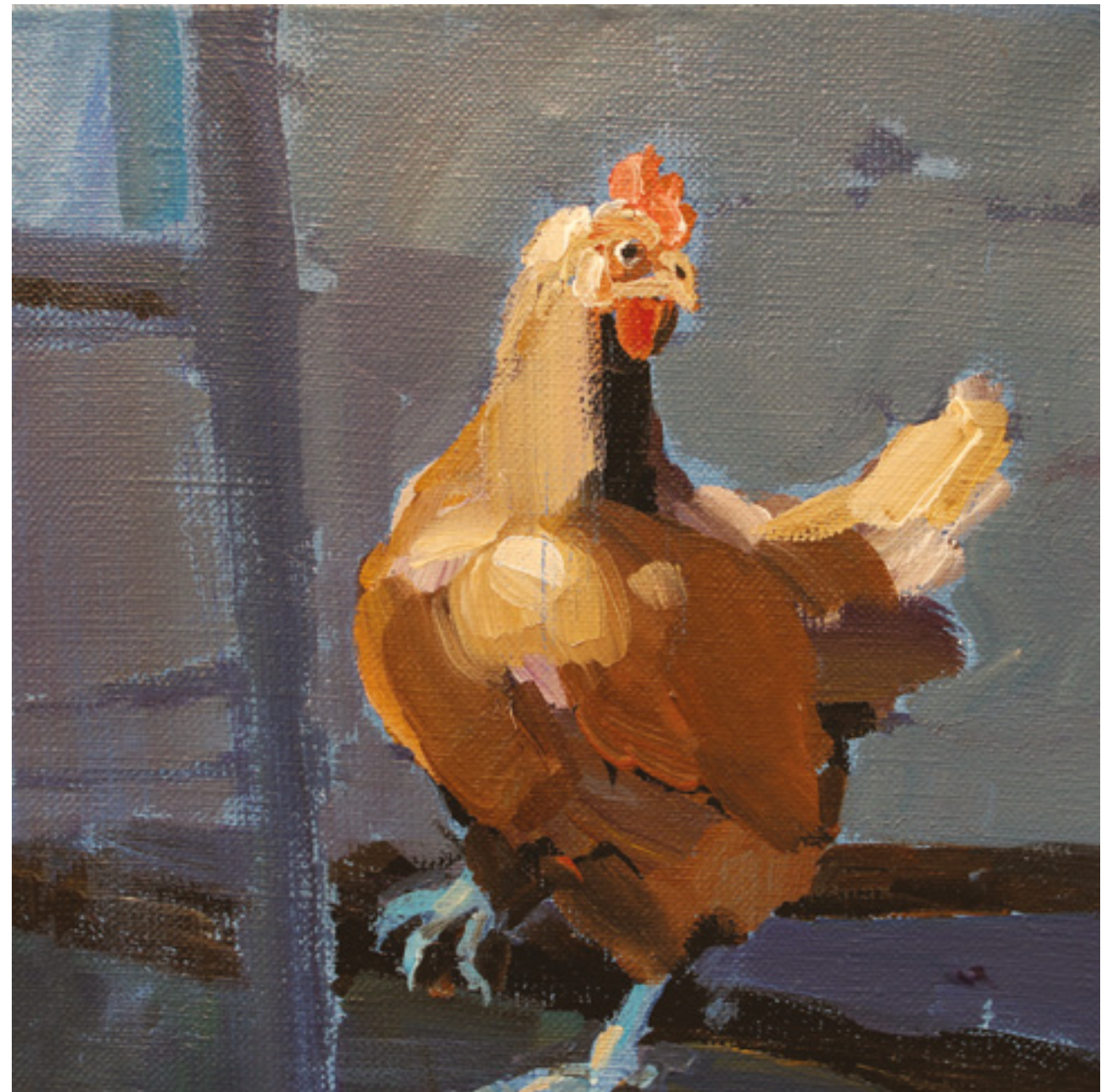
Kury w kurzym niebie II , 20 x 20 cm, akryl na płótnie, 2020