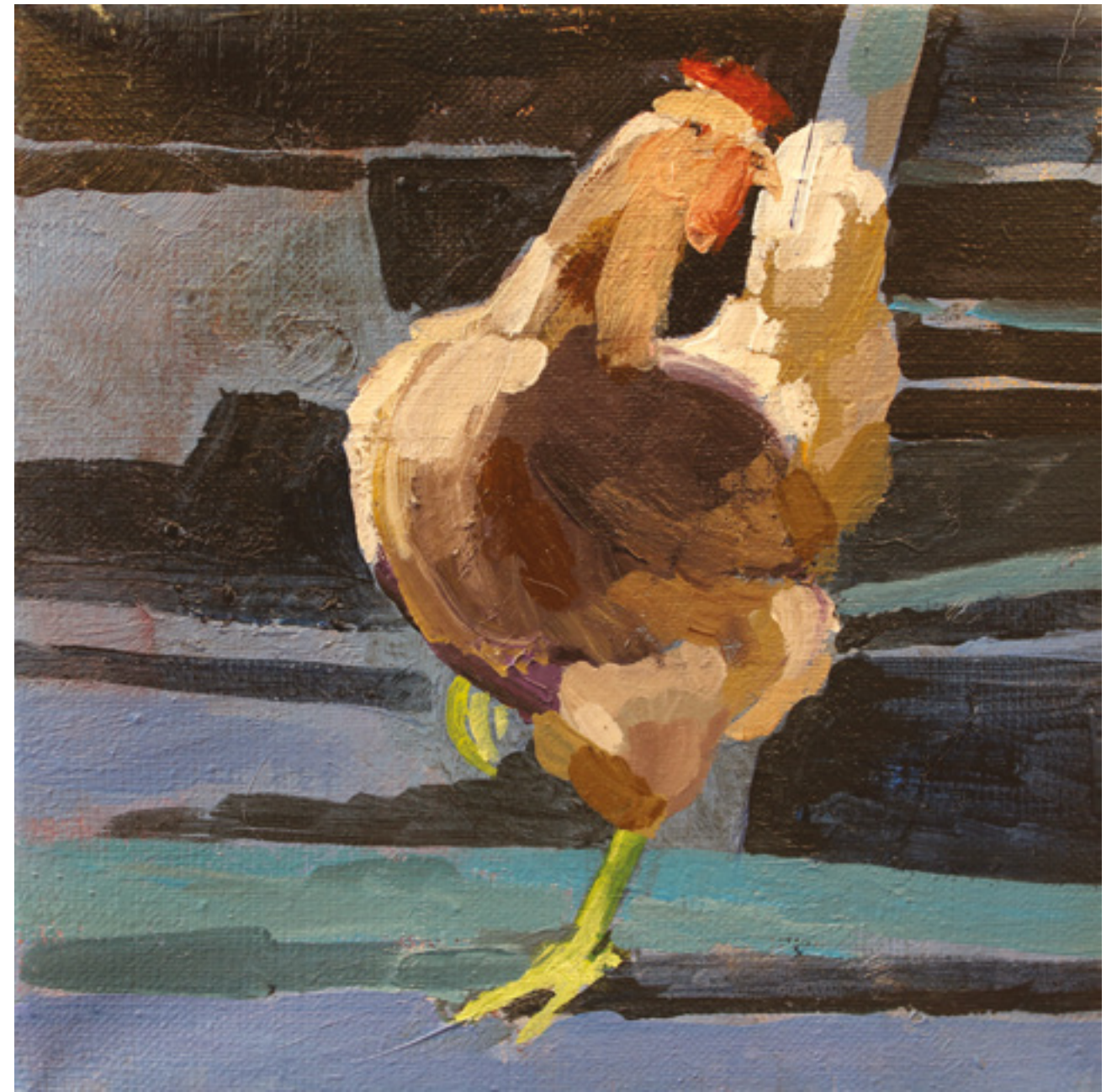
Kury w kurzym niebie IV , 20 x 20 cm, akryl na płótnie, 2020