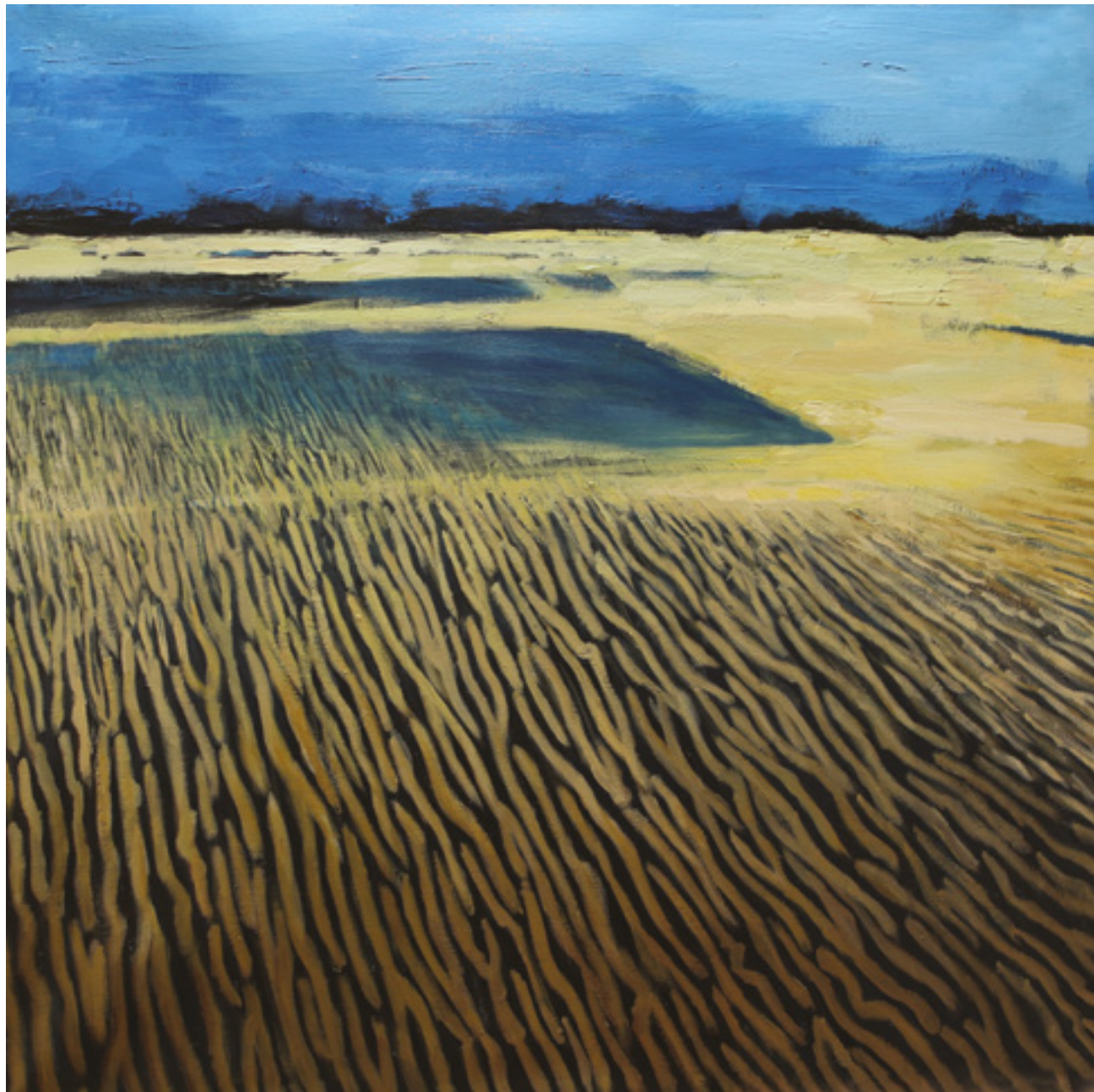
Wydmy II , 100 x 100 cm, akryl na płótnie, 2019