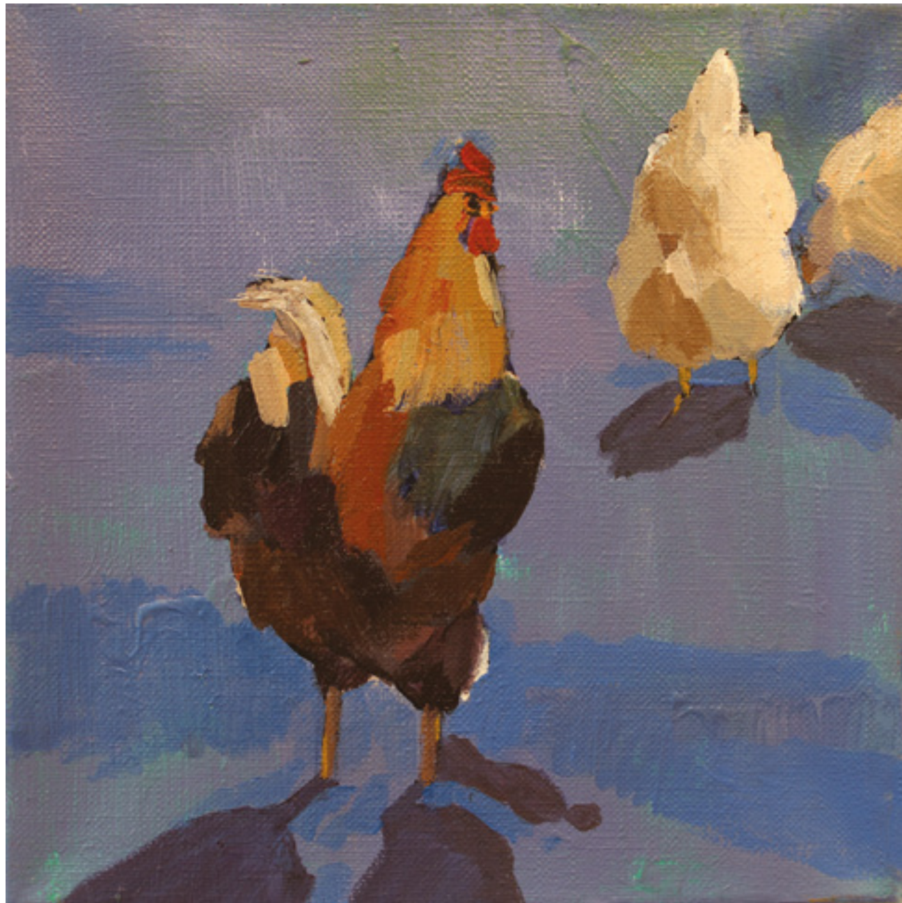
Kury w kurzym niebie VII , 20 x 20 cm, akryl na płótnie, 2020