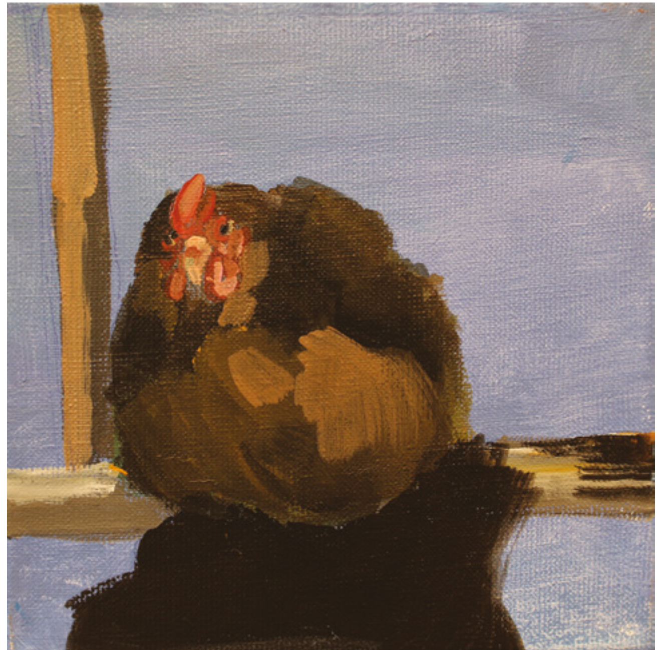
Kury w kurzym niebie VI , 20 x 20 cm, akryl na płótnie, 2020