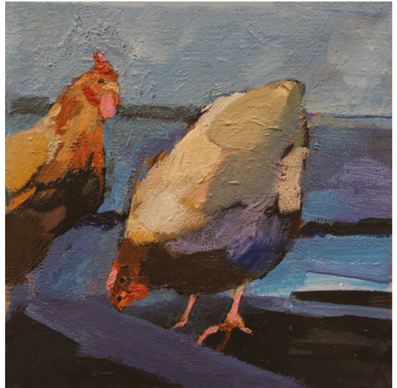
Kury w kurzym niebie VIII , 20 x 20 cm, akryl na płótnie, 2020