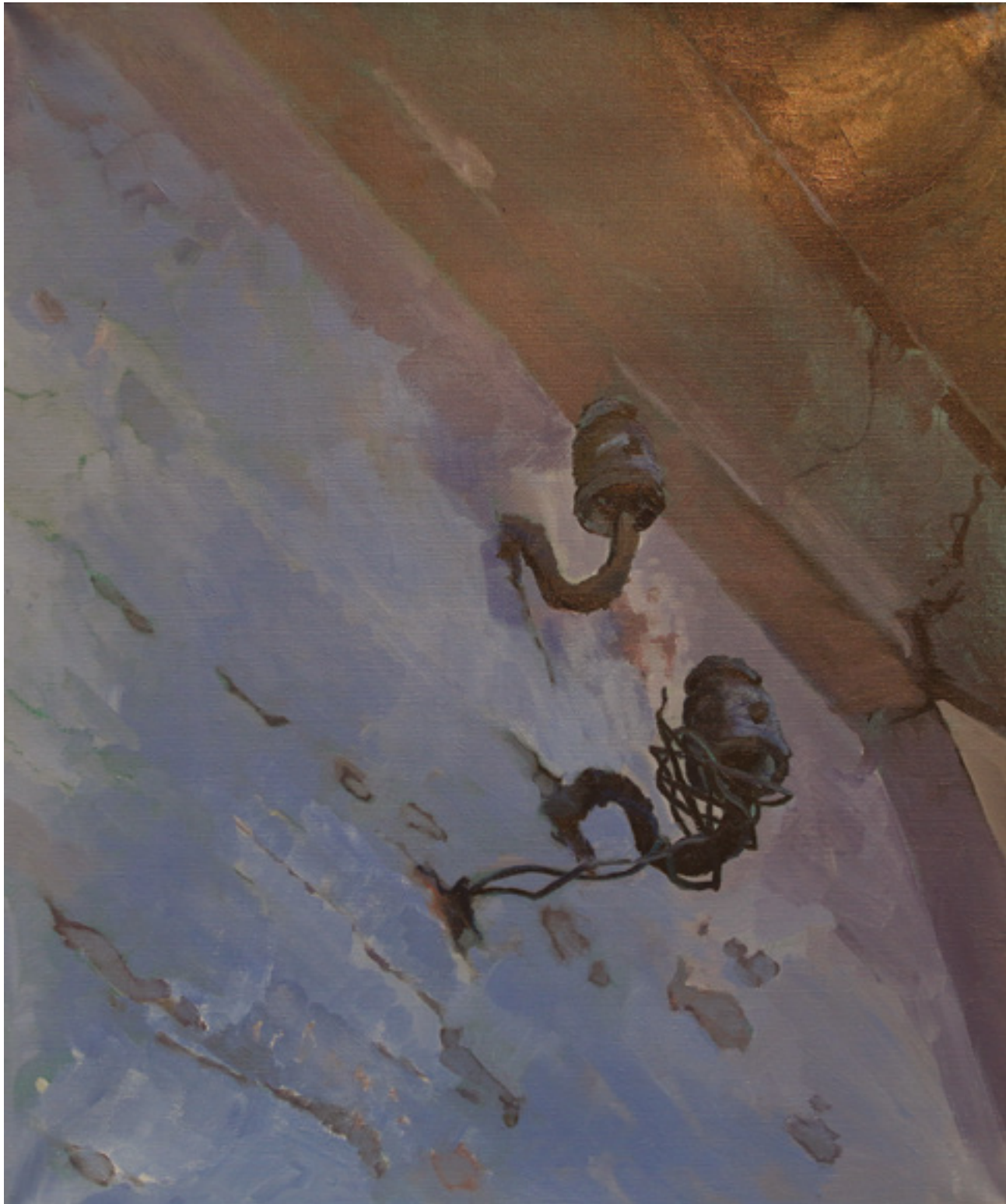
Fajki , 60 x 50 cm, akryl na płótnie, 2019