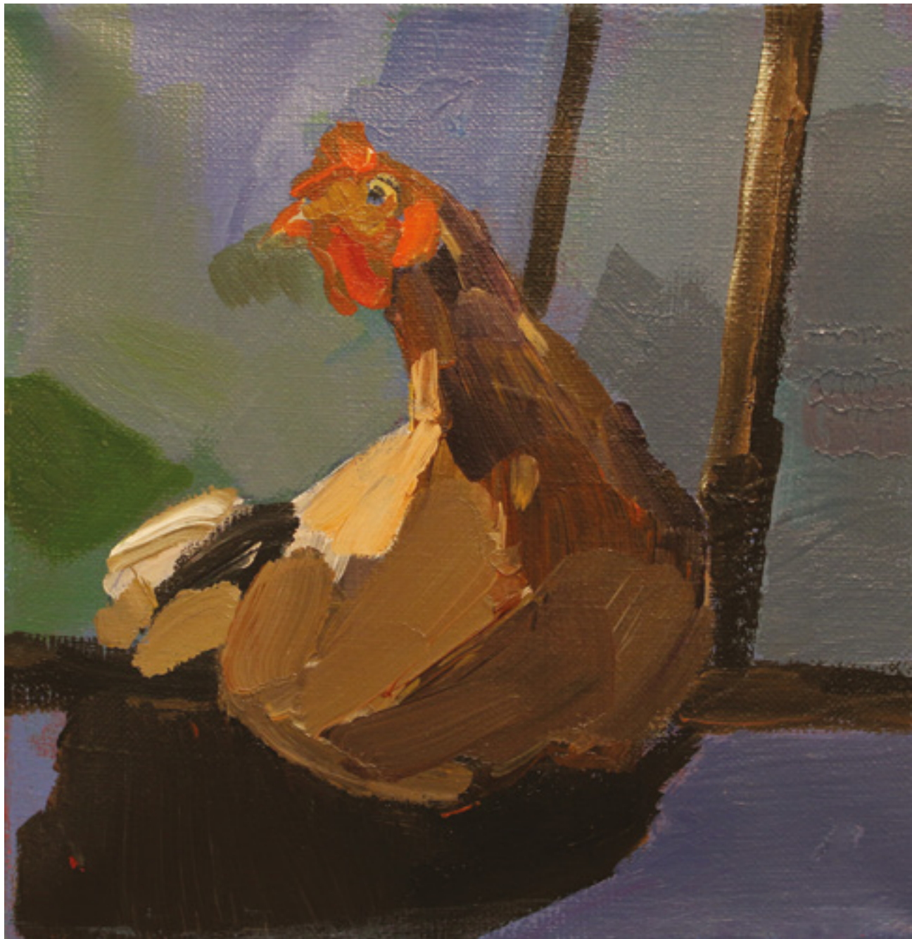
Kury w kurzym niebie XV , 20 x 20 cm, akryl na płótnie, 2020