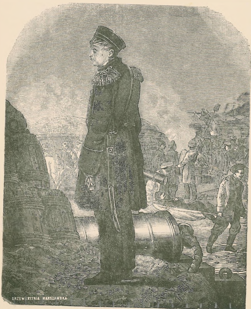
И. С. НАХИМОВЪ.