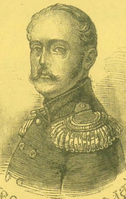
ИМПЕРАТОРЪ НИКОЛАЙ I