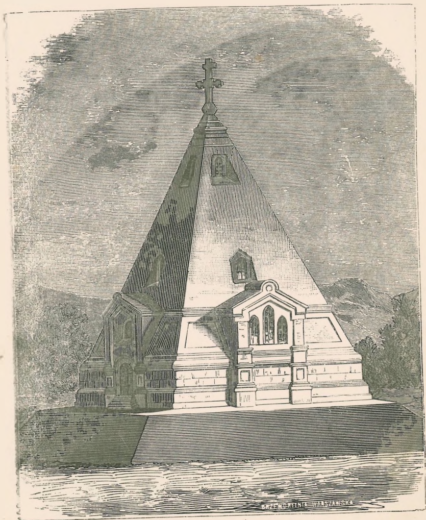
Кладбищенская церковь на СЪВЕРНОЙ СТОРОНѢ.