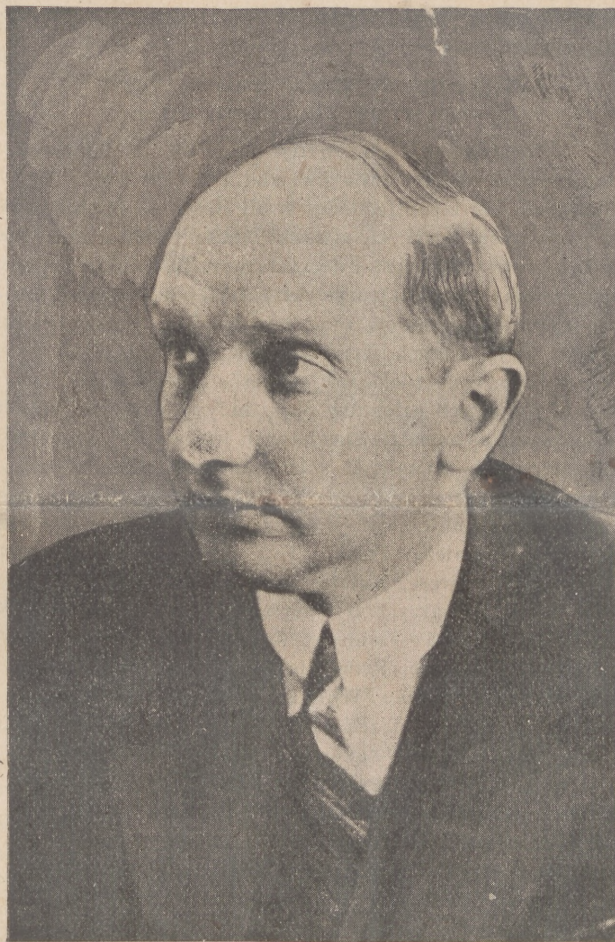
Minister August Zaleski

Prezes Rady Naczelnej Polskiego Touring Klub